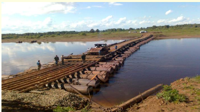
Расходы дорожного фонда

В 2014 году планируется капитальный ремонт 1 км 200 м автодороги Даровской – Кобра, в 2015 году – 3 км 300 м автодороги Даровской – Верховонданка, в 2016 году - 3 км 500 м автодороги Даровской – Кобра.